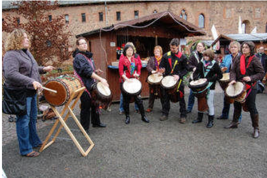
Viel Applaus erntete die Geismarer Trommelgruppe „Nala Guitar“ für ihren Auftritt beim Klostermarkt.

Frankenberg (gi). Der zweite „Markt im Klosterhof“ hat alle Erwartungen übertroffen. Auf Frankenbergs schönstem Platz, umringt von den Mauern des ehemaligen Kloster St. Georgenberg, herrschte am Samstag reger Betrieb.